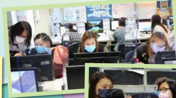
家長們在工作坊裏練習錄製影片的方法