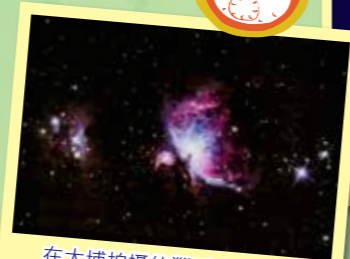
在大埔拍攝的獵戶座大星雲