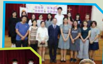
小朋友成長路上的同行者，家校合作不可或缺。