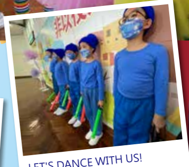
LET'S DANCE WITH US!