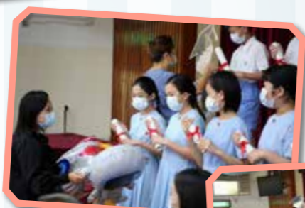
老師耐心地指導學生