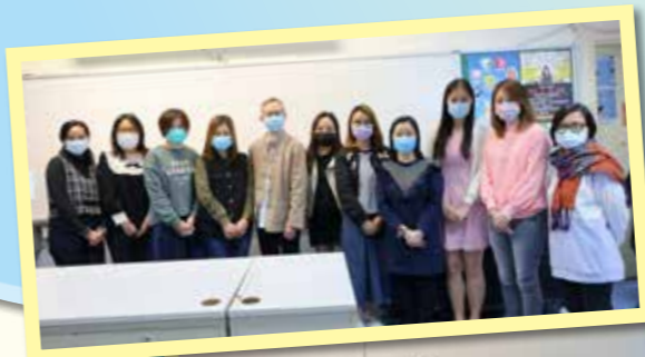
參與「錄製繪本故事」家長工作坊的家長

為預備來年校本課程 LIFE，本校邀請了 14 位家長為繪本故事錄製成影片，以在課程中使用。我們為錄製繪本故事的家長舉行了兩節「錄製繪本故事」家長工作坊，家長從中了解錄製繪本故事的過程。想聽家長們說的繪本故事？大家明年在 LIFE 就可以聽到了！