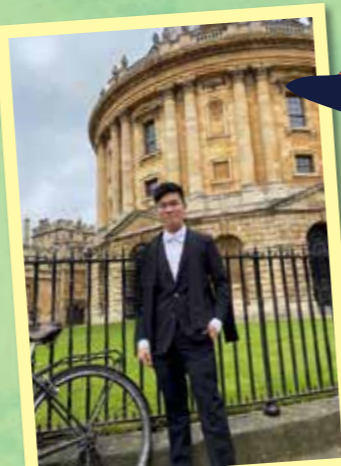
英國牛津大學入學照

笛卡兒「我思故我在」的哲學說明人的生存意義在乎其思想，而在這個人云亦云時代裏，獨立的見解、思維和夢想變得更為重要。有人說讀物理沒有前途，但我仍然堅持對探索宇宙、尋找真理的追求，抱著隨遇而安的心來到異地攻讀這科—且看這種跟隨內心、忠於自我的心態能否將我牽引到更遠、更深、更廣的境界。