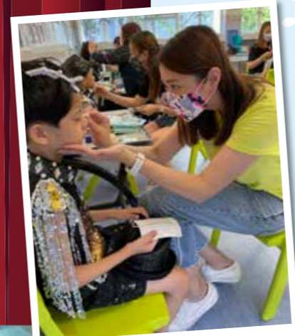
十分感謝一班家長義工落足心思幫我們化妝