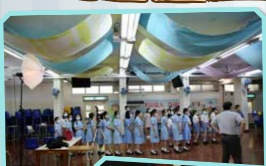
同學們認真地聽攝影師的指示