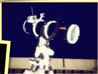
中一時購買的簡單望遠鏡