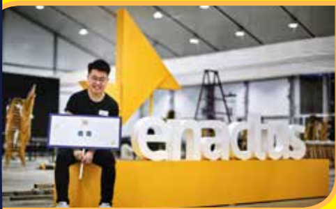
帶領香港隊與全國大學生交流社企項目