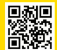
十週年音樂劇《十年的愛》幕後花絮

校慶音樂劇《十年的愛》原定於上年 2020 年演出的，但因疫情關係，音樂劇無奈被延期。今年我們決定轉換演出形式，把實地演出轉為微電影的方式呈現給大家。籌備的過程有賴一群盡心盡力的同學，家長和老師，大家排除萬難，才能順利完成錄製工作。這正實踐劇中的中心思想「因為有愛，才有更完美的人生」。盼望夢芹銀禧的愛延續更多個十年。