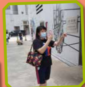
「食飽飯周圍 Look」，老師透過 ZOOM 帶同學們走到不同地方，用心細察身邊一事一物。