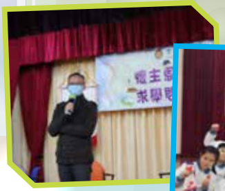
在疫情下仍為小六同學舉辦模擬面試講座

「願平安、仁愛、信心從父神和主耶穌基督歸與弟兄們！並願所有誠心愛我們主耶穌基督的人都蒙恩惠！」 (弗 6:23)