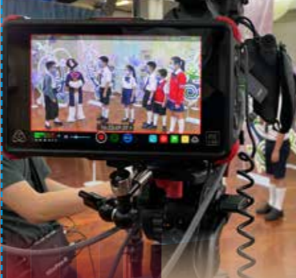
鏡頭裏的最佳主角