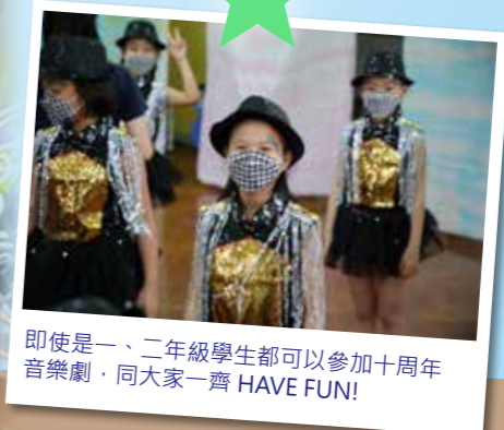
即使是一、二年級學生都可以參加十周年音樂劇，同大家一齊 HAVE FUN!