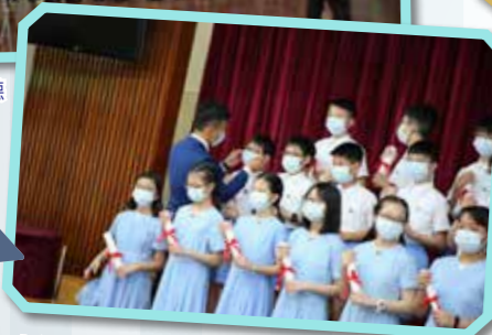
老師細心地為學生整理儀容