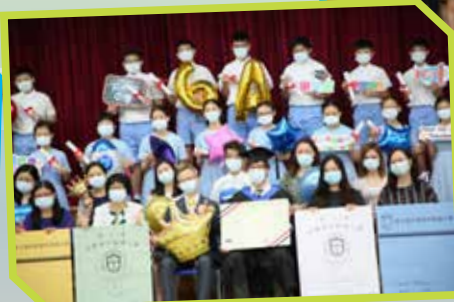
戴着口罩的畢業照，加上各種道具，真是難忘極了！