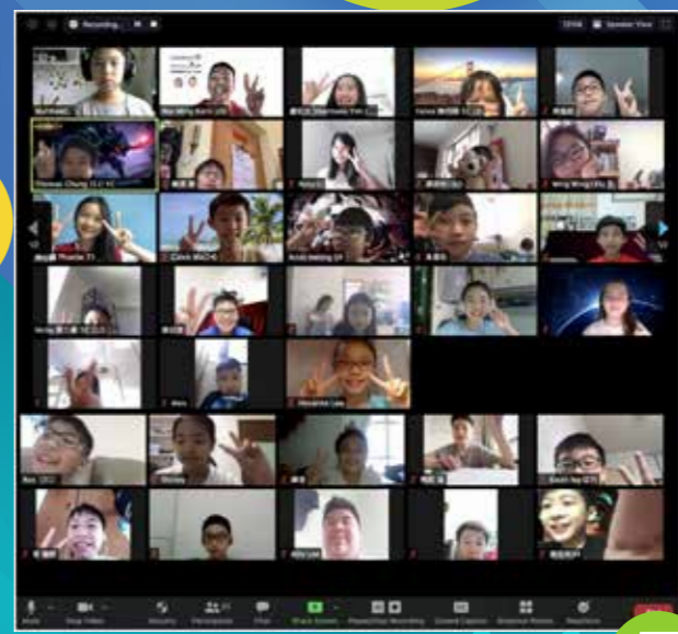
雖然疫情把我們困在家裏·大家也可以網上相見!