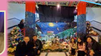
與新北市私立聖心國民小學的學生們同上「心靈有約」課堂。