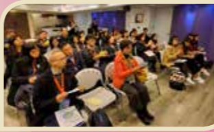
到訪「得勝者教育協會」