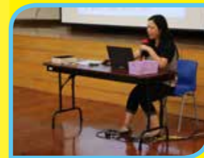
「促進以自主學習開展 STEM 教學創新多層領導網絡 (SDLS-MLN)」計劃分享會

為建立學習型教師團隊，本校定期為教師舉行不同的工作坊和交流會，藉不同的持續專業發展活動，以提升教學質素。