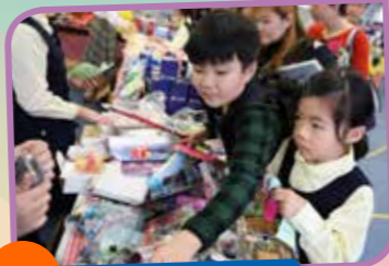
同學們興奮地換禮物。