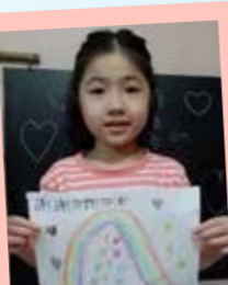
Cheukwing Yuen 謝謝你們! 加油!