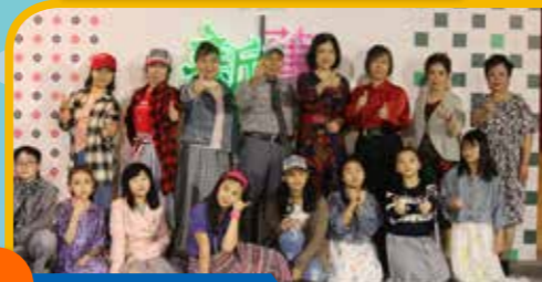
色彩奪目的親子時裝展。