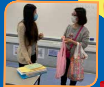
老師向家長了解學生停課在家的情況。