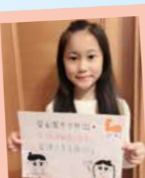
陳芷恩 留在家中少外出·多做運動勤洗手·醫護人員支持你! 加油!