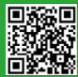
體育科: Baby shark challenge