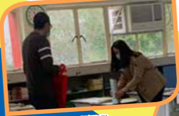
老師為學生分配課業·讓家長到校領取。