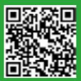
音樂科: 杯子玩音樂