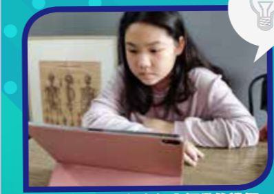
同學專心聆聽老師在網上課堂的講解。