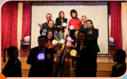
嘉賓手持象徵聖靈果子的燈進行啟動儀式。

為慶祝創校十周年，本校於二零二零年一月十一日（星期六）舉行了「十周年校慶嘉年華」。當天節目豐富，有啟動禮、學生表演、各科展覽及攤位遊戲等，場面十分熱鬧，校園內洋溢著一片歡樂氣氛。