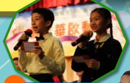
小司儀在啟動禮中風趣幽默，帶動現場開心愉快氣氛。