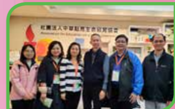
到訪「社團法人中華點亮生命教育協會」