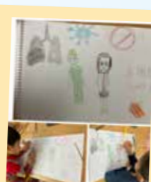
Iris Fong 多謝您們! Support you!