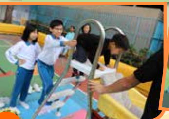
活潑好動的小朋友最愛戶外遊戲。