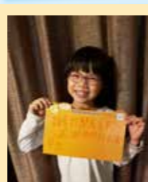
陳妍熹 親愛的醫護人員: 感謝你們救香港!