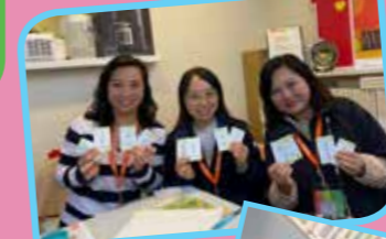
親身體驗如何使用教具，讓學生思考和反省生命價值和意義