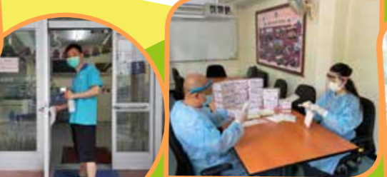
職員們正準備防疫心意包。