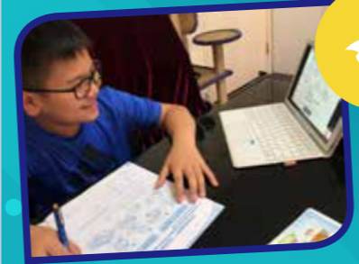
坐定定·愉快投入網上課堂。