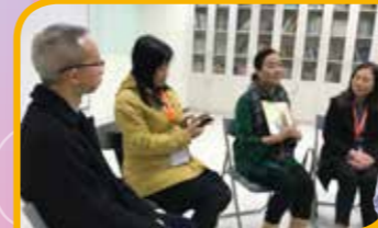
活動體驗：繪本故事共同備課會