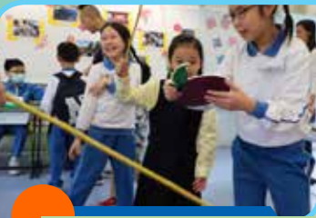
受歡迎又有趣的攤位遊戲。