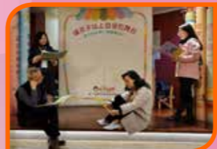
花花姐姐說故事劇場