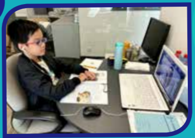
電腦·耳筒·課本·準備好上堂啦!