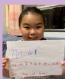
王心祈 加油! 我們留在家中·齊心抗疫! We stay at home!