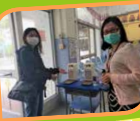
學校的大門前放置了充足的防疫設施。