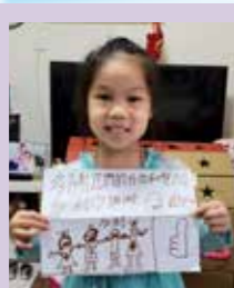
司徒雪瑩 多謝你們付出和努力! 加油! 謝謝!