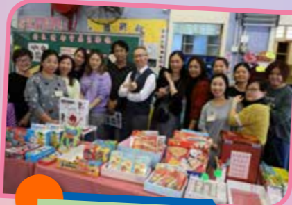
家長義工們與朱校長合照。