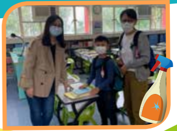
同學親自回到學校領取課業·這麼久沒跟老師見面·合照一張吧!