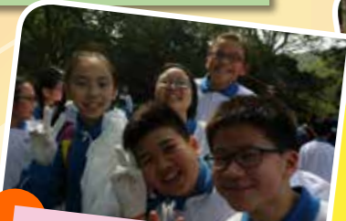
遊玩過後，不忘清潔公園。