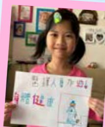
林晴雅 醫護人員加油! 身體健康!