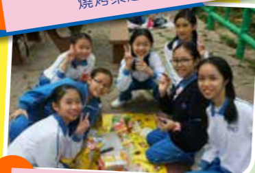
自備美食，享受野餐樂趣。