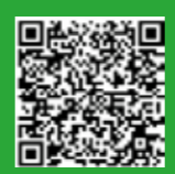
視藝科: 美麗的花朵