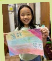
曾樂施 醫護人員努力加油!