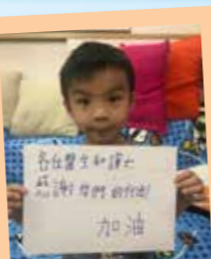
何靖軒 各位醫生和護士: 感謝你們的付出! 加油!